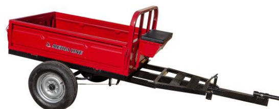
Remorcă 400 kg sau 500 kg